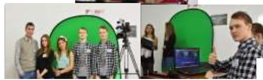
Специалисты медиацентра техникума