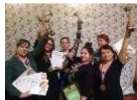
Фестиваль «Невские берега», г. Санкт-Петербург, 2016