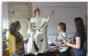
День самоуправления, 2014

После окончания учебных занятий, студенты активно участвуют во внеаудиторной деятельности: организация и проведение творческих конкурсов, диспутов, конференций, экскурсий, оформление презентаций и др.