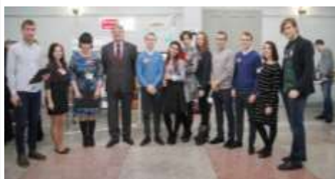
Городская ярмарка студенческой молодежи, 2017