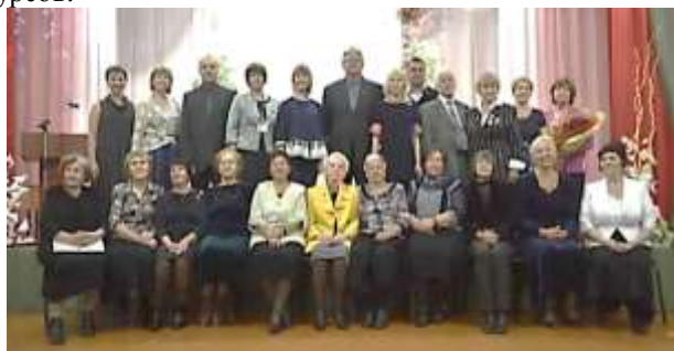
Юбилей ГПОУ КузТСиД им. Волкова В.А., 2016

Это солидный возраст для любого учебного учреждения, которое является хранителем большой истории, традиций и значимых достижений. Мы прошли долгий путь становления и развития от учебно – производственного комбината - до одного из крупнейших учебных учреждений среднего профессионального образования Кемеровской области. Сегодня наш техникум – это современный образовательный центр, осуществляющий подготовку по широкому спектру востребованных специальностей и профессий. В настоящее время контингент обучающихся составляет более 800 человек, среди них – заслуженные победители и призеры международных, российских и республиканских олимпиад и конкурсов.