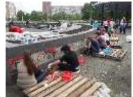
Реализация проекта Арт-сквера студентами по специальности «Дизайн (по отраслям)», 2014