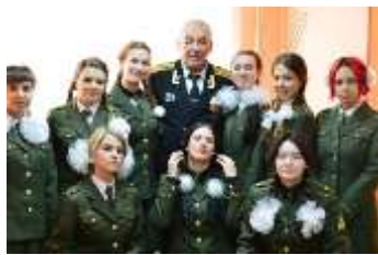
Пост № 1, 2014