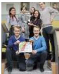
Ярмарка студенческой молодежи - 1 место