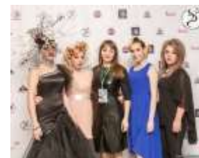
Чемпионат «Сибирская Звезда», 2016