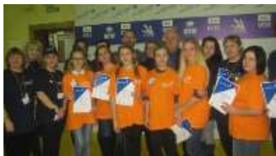
Чемпионат WorldSkills Russia, 2016