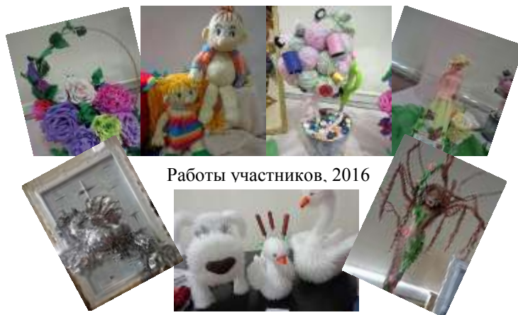
Работы участников, 2016

Пусть в школах нашей области вспыхивают новые звезды, радуя нас своей яркостью и красотой, талантом и неповторимостью.