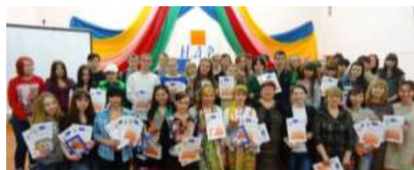
Победители конкурсно-выставочного проекта «Неделя Дизайна и Рекламы», 2016

Важной традицией стало проведение конкурсно-выставочного проекта «Неделя дизайна и рекламы» (НДР). Это творческий отчет о результатах дизайнерской деятельности студентов и преподавателей за прошедший учебный год, который предоставляет возможность публичного экспонирования своих творческих работ и умения презентовать данные произведения для оценки независимого жюри.