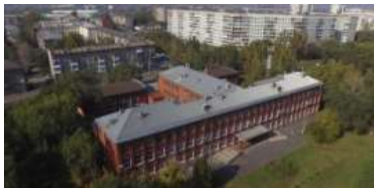
ГПОУ КузТСиД им. Волкова В.А. (ул. Покрышкина, 36)