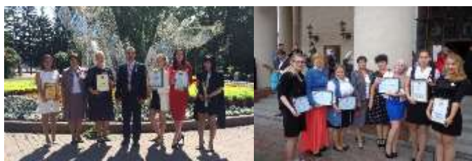
Губернаторский прием, 2016