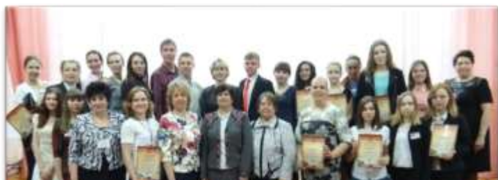
Победители Всероссийской научно-практической конференции, 2016

Ежегодно в стенах техникума для обучающейся молодежи и преподавателей проходит НПК, целью, которой является повышение значимости и качества научно-исследовательской деятельности обучающихся. Участвуя в научно-исследовательской работе, студенты повышают свой интеллектуальный уровень, заряжаются энергией, расширяют кругозор, приобретают навыки коммуникативного общения. Диапазон городов -участников НПК очень велик. Это такие города как Новокузнецк, Осинники, Прокопьевск, Ленинск-Кузнецкий, Юрга, Кемерово, Новосибирск, Томск, Санкт-Петербург, Москва, Анапа, Брянск, Трубчевск, многие города Чувашии.