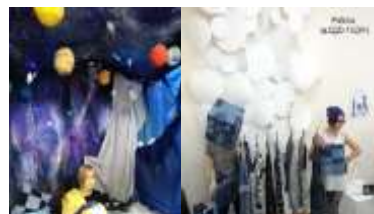
Проекты студентов по специальности «Дизайн (по отраслям)»