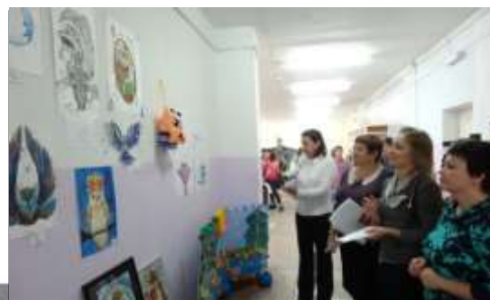
Работа жюри на конкурсе НДР, 2016